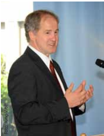
Ausschussvorsitzender Jo Leinen

Am 28. Oktober 2010 ging Herbert Reul, Vorsitzender des Ausschusses für Industrie, Forschung und Energie des Europäischen Parlaments, im Rahmen eines Mittagsgesprächs auf aktuelle Themen wie Energieeffizienz, Versorgungssicherheit und die Chancen des Klimaschutzes ein und gab Einblick in die Arbeit seines Ausschusses.