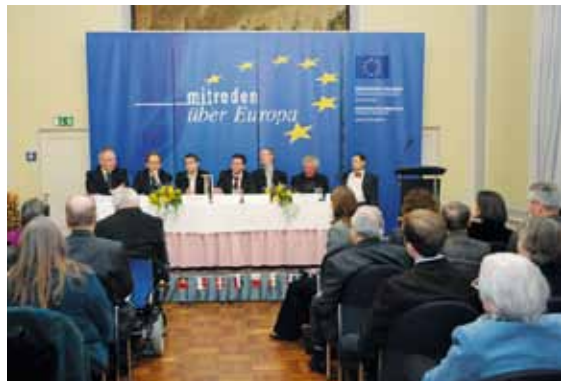
Bürgerforum Bonn 4. Februar 2010

2010 waren es die Bürgerinnen und Bürger in Koblenz, Halle, Bonn und Regensburg, die sehr zahlreich die Möglichkeit nutzten, mit ihren Europaabgeordneten ins Gespräch zu kommen und sich über die aktuelle Europapolitik zu informieren.