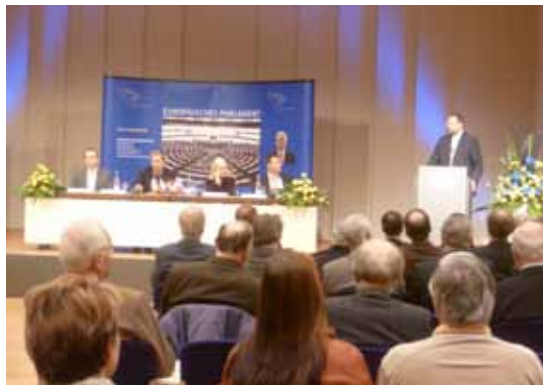
Bürgerforum in Pforzheim am 26. November 2010

Wie wirken sich die Entscheidungen der Europäischen Union vor Ort aus? Wie geht es mit der gemeinsamen Währung weiter? Wie hat der Vertrag von Lissabon die EU verändert? Was wird aus der Idee einer Europäischen Bürgerinitiative? Wie wird die europäische Agrarpolitik nach 2013 aussehen? Dies waren die am häufigsten gestellten Fragen bei zwei Bürgerforen, die in Augsburg und Pforzheim Bürgerinnen und Bürgern Gelegenheit gaben, mit Mitgliedern des Europäischen Parlaments aus ihrer Region und einem Vertreter der Kommission zu diskutieren. Aber auch Themen wie die Klima- und Energiepolitik, Europas Rolle bei der Bekämpfung der Finanzkrise und die Frage, durch welche Mechanismen sich künftig die Haushaltslage aller Mitgliedstaaten nachhaltig stabilisieren lässt, spielten in den Diskussionen eine wichtige Rolle.