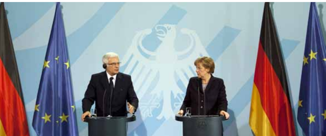
Pressekonferenz im Bundeskanzleramt