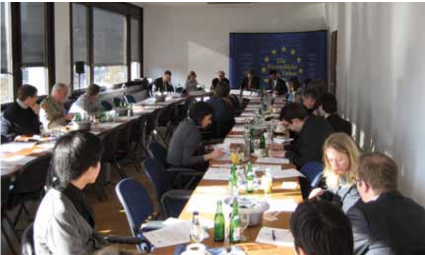
Seminar im Europäischen Haus

In Zusammenarbeit mit der Europäischen Akademie Berlin und der Stiftung Wissenschaft und Politik veranstaltete das Informationsbüro die Seminarreihe „Aktuelle Entwicklungen in der EU“. Ziel der Reihe war es über die aktuellen Entwicklungen ein Jahr nach Inkrafttreten des Vertrags von Lissabon zu informieren und einen Austausch darüber zu ermöglichen. Teilnehmer der Seminare waren im Bundestag tätige Referenten und Assistenten sowie Mitarbeiter der öffentlichen Verwaltung.