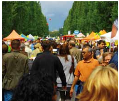
Corso Leopold 11. September 2010