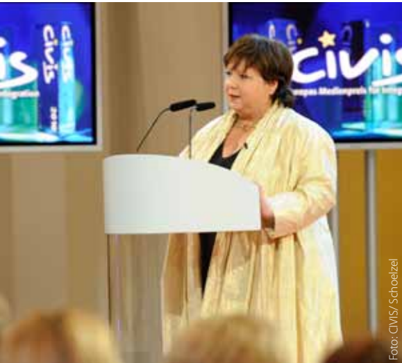
Vizepräsidentin Dagmar Roth-Behrendt

Unter der Schirmherrschaft von Parlamentspräsident Buzek wurde der 23. CIVIS Medienpreis für Integration und kulturelle Vielfalt am 6. Mai 2010 im Auswärtigen Amt in Berlin verliehen.