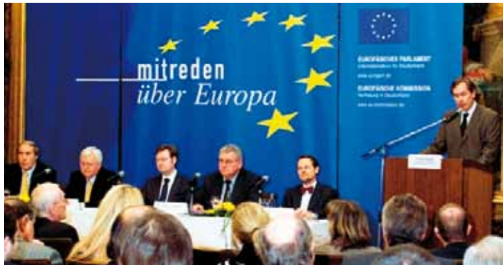
Bürgerforum Koblenz 25. Februar 2010

der Europäischen Kommission zur Verfügung.