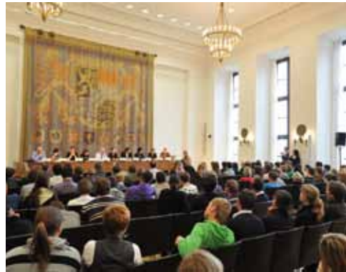
Jugendforum im Bayerischen Landtag 26. Februar 2010

In Berlin stellte sich zudem der EU-Kommissar für Energie Günther Oettinger den Fragen der Jugendlichen.