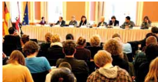
Jugendforum im Berliner Rathaus 10. Mai 2010

Vorbereitet wurden die teilnehmenden Schulklassen auf die Themen der Energie- und Klimaschutzpolitik im Vorfeld der Jugendforen in Unterrichtseinheiten unter der Anleitung renommierter Wissenschaftler und Experten.