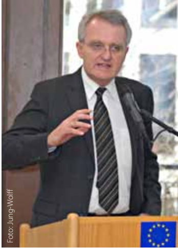
Vizepräsident Rainer Wieland

Das Informationsbüro des Europäischen Parlaments in Deutschland lädt seit Anfang 2010 regelmäßig zu den sogenannten Mittagsgesprächen ins Europäische Haus in Berlin ein. Die Reihe der Mittagsgespräche bietet den deutschen Vizepräsidenten und Ausschussvorsitzenden im Europäischen Parlament die Möglichkeit, ihre Arbeit vor einem Berliner Fach-, Medien- und öffentlichen Publikum vorzustellen.