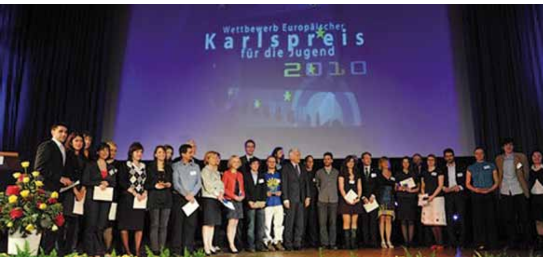
Preisverleihung des Karlspreis der Jugend in Aachen am 11. Mai 2010