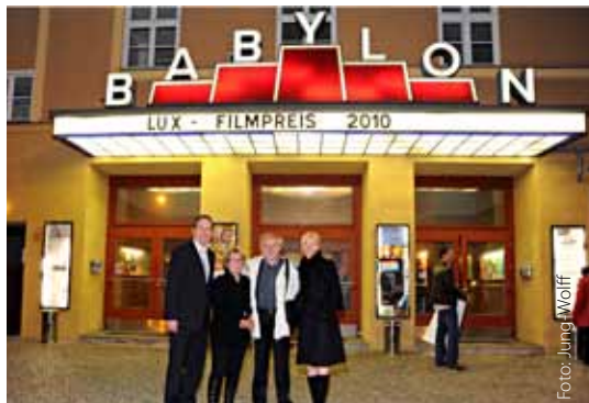
Lux-Filmpreis in Berlin

Die drei Filme Die Fremde (Deutschland, Feo Aladag), Illégal (Belgien, Olivier Masset-Depasse) und Kleine Wunder in Athen (Deutschland/Griechenland, Filippos Tsitos) wurden sowohl für das Berliner als auch für das Münchener Publikum gezeigt.