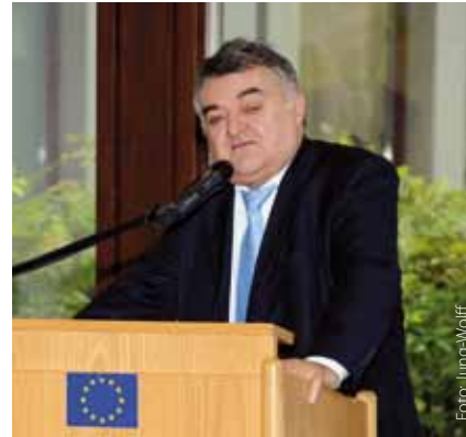
Ausschussvorsitzender Herbert Reul

Am 7. Juni 2010 diskutierte der Vorsitzende des Umweltausschusses des Europäischen Parlaments Jo Leinen die Frage: „Wie geht es weiter mit dem Klimaschutz? Die Rolle der Europäischen Union auf dem Weg nach Cancún“. Er berichtete dabei aktuell aus den Verhandlungen zur Vorbereitung der UN-Klimakonferenz.