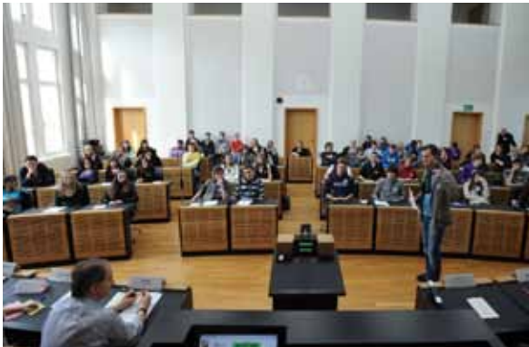
Jugendforum im Landtag des Saarlandes 19. März 2010

Bei den Europäischen Jugendforen stand der Dialog zwischen Politikern und Jugendlichen im Mittelpunkt. Die Abgeordneten vermittelten europäische Standpunkte in der Klimapolitik und erfuhren etwas über die Meinungen der jungen Generation. Den Abgeordneten wurden die abschließenden Abstimmungsergebnisse der Projekttagsteilnehmer nach Straßburg und Brüssel gesandt, und die Jugendlichen nahmen vielfältige Eindrücke mit nach Hause.