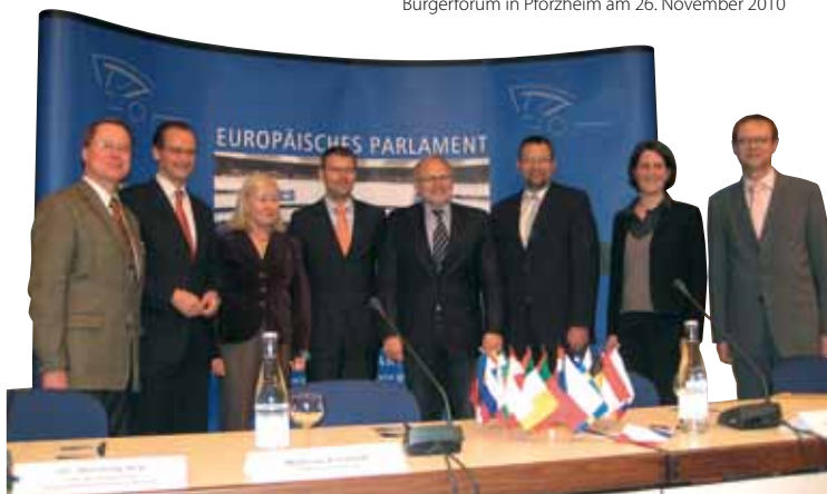
Bürgerforum in Pforzheim am 26. November 2010