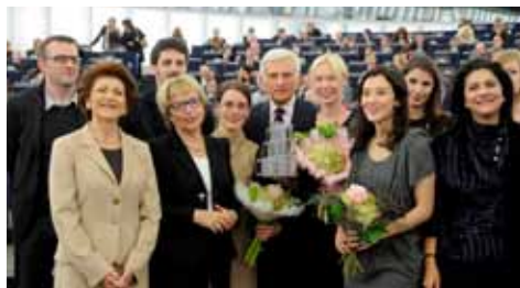
Preisverleihung in Straßburg 24. November 2010

Das Informationsbüro verfolgte bei der Vorführung das Ziel, die drei Finalfilme einer breiteren Öffentlichkeit bekannt zu machen. In beiden Städten besuchten jeweils mehrere hundert Kinofreunde die stets ausgebuchten Vorstellungen.