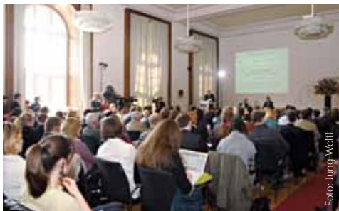
Humboldt-Rede im Senatssaal

Bei seinem zweitägigen Berlin-Besuch sprach der Präsident im Rahmen der Reihe „Humboldt-Rede zu Europa“ im Senatssaal der Humboldt-Universität zu Berlin. Jerzy Buzek plädierte leidenschaftlich dafür, die Gemeinschaftsmethode zu stärken: „Unsere Bürger und Politiker müssen sich über eines im Klaren sein: Wenn wir heute die Europäische Union schwächen, stärken wir damit nicht die Nationalstaaten, sondern wir schwächen sie“.