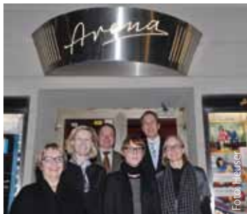
Lux-Filmpreis in München

Das Informationsbüro des Europäischen Parlaments in Deutschland präsentierte vom 14. bis 16. November im Kino Babylon in Berlin sowie vom 17. bis 19. November 2010 im Kino „Neue Arena“ in München die drei Finalisten des LUX-Filmpreises 2010.