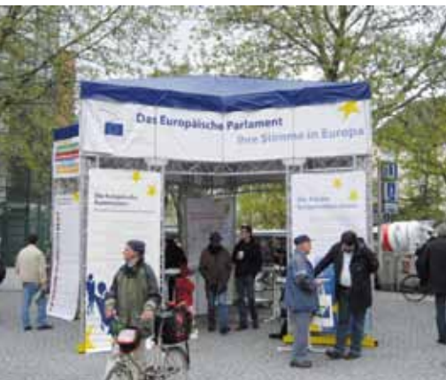
Europatag München 7. Mai 2010

Anlässlich der Europawoche war am 7. Mai 2010 der Informationspavillon des Parlamentsbüros im Rahmen eines Europafests auf dem Münchner Rotkreuzplatz im Einsatz. Am zweiten Septemberwochenende stand der Pavillon beim großen Münchener Straßenfest „Corso Leopold“ im Herzen Schwabings. Bei beiden Gelegenheiten nutzten jeweils mehr als tausend Bürgerinnen und Bürger die Gelegenheit, mit Mitgliedern des Europäischen Parlaments zu diskutieren, sich über eine Vielzahl von europäischen Themen zu informieren und sich mit Informationsmaterial einzudecken.