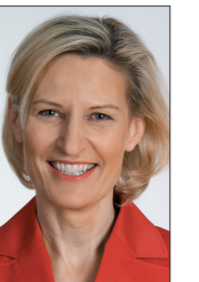
DR. ANGELIKA NIEBLER CSU

CSU-Kreisgeschäftsstelle Münchner Straße 2 85560 Ebersberg Tel.: 0 80 92 / 86 57 70 Fax: 0 80 92 / 25 69 20