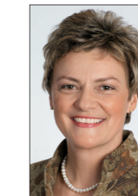
MONIKA HOHLMEIER CSU

Europabüro Oberfranken Laurenzstraße 12 96215 Lichtenfels Tel.: 0 95 71 / 7 58 38 28 Tel.: 0 95 71 / 7 58 44 61 Fax: 0 95 71 / 7 58 38 29