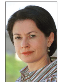
BARBARA LOCHBIHLER Bündnis 90/Die Grünen

EFD Fraktion »Europa der Freiheit und der Demokratie«