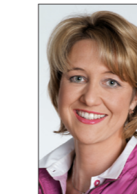
DR. ANJA WEISGERBER CSU

Europabüro Karl-Götz-Straße 17 97424 Schweinfurt Tel.: 0 97 23 / 93 43 70 Fax: 0 97 23 / 93 43 85