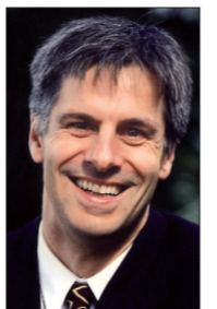
GERALD HÄFNER Bündnis 90/Die Grünen

Europabüro Fuststraße 5 80638 München Tel.: 089 / 15 93 05 50 Fax: 089 / 15 93 05 51