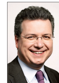
MARKUS FERBER CSU

CSU-Europabüro Peutingerstraße 11 86152 Augsburg Tel.: 08 21 / 3 49 21 10 Fax: 08 21 / 3 49 30 21