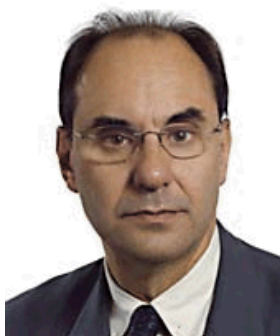
Prof. Alejo VIDAL-QUADRAS