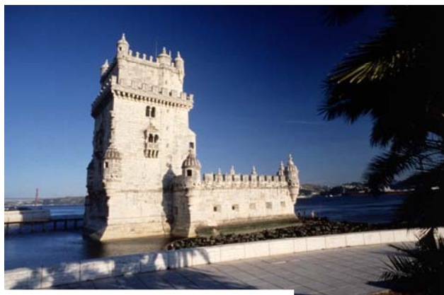
Lissabon - Belem Turm

Die Antragsformulare und Merkblätter für die Eintragung in ein Wählerverzeichnis zur Europawahl sind im Internetangebot des Bundeswahlleiters bereits verfügbar oder ab Frühjahr 2009 bei den Kreiswahlleitern in Deutschland sowie bei allen diplomatischen und konsularischen Vertretungen der Bundesrepublik im Ausland als Papiervordruck erhältlich.